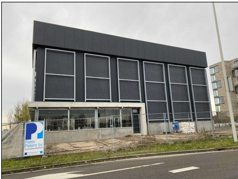
Afbeelding 2: Aanleg gevelreclame op het dak van de carwash aan de Barckalaan, Fascinatio, Capelle aan den IJssel

Deze bouwactiviteiten dienen derhalve onmiddellijk te worden stopgezet en alle materialen ten aanzien van en/of ten behoeve van de gevelreclame dienen onmiddellijk te worden verwijderd.