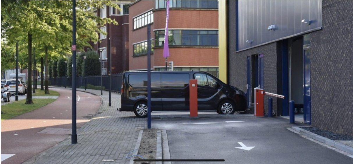
2. Zelfs een busje is al te lang om op het eigen terrein te passen.