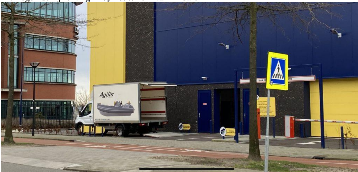
12. Tegen de rijrichting in op het terrein van Allsafe