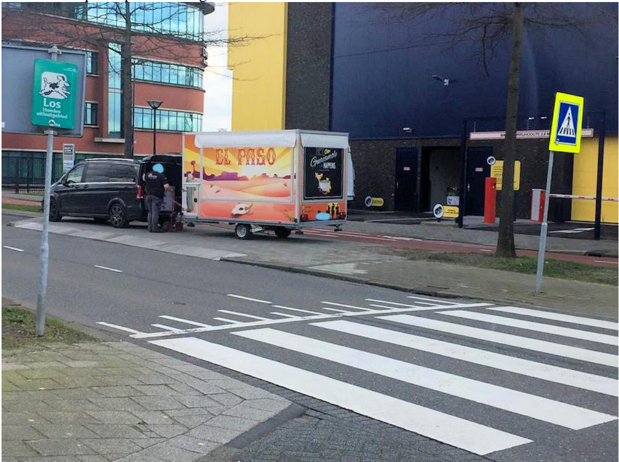
18. Blokkeren van de inrit en uitrit van Allsafe