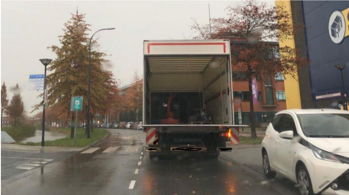
22. Parkeren op de weg, blokkeert de brug die uitgang is uit de wijk. Staat deels op zebrapad.