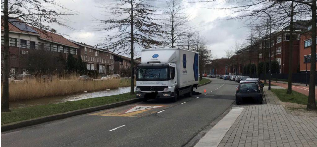
17. Lossen op de openbare weg.