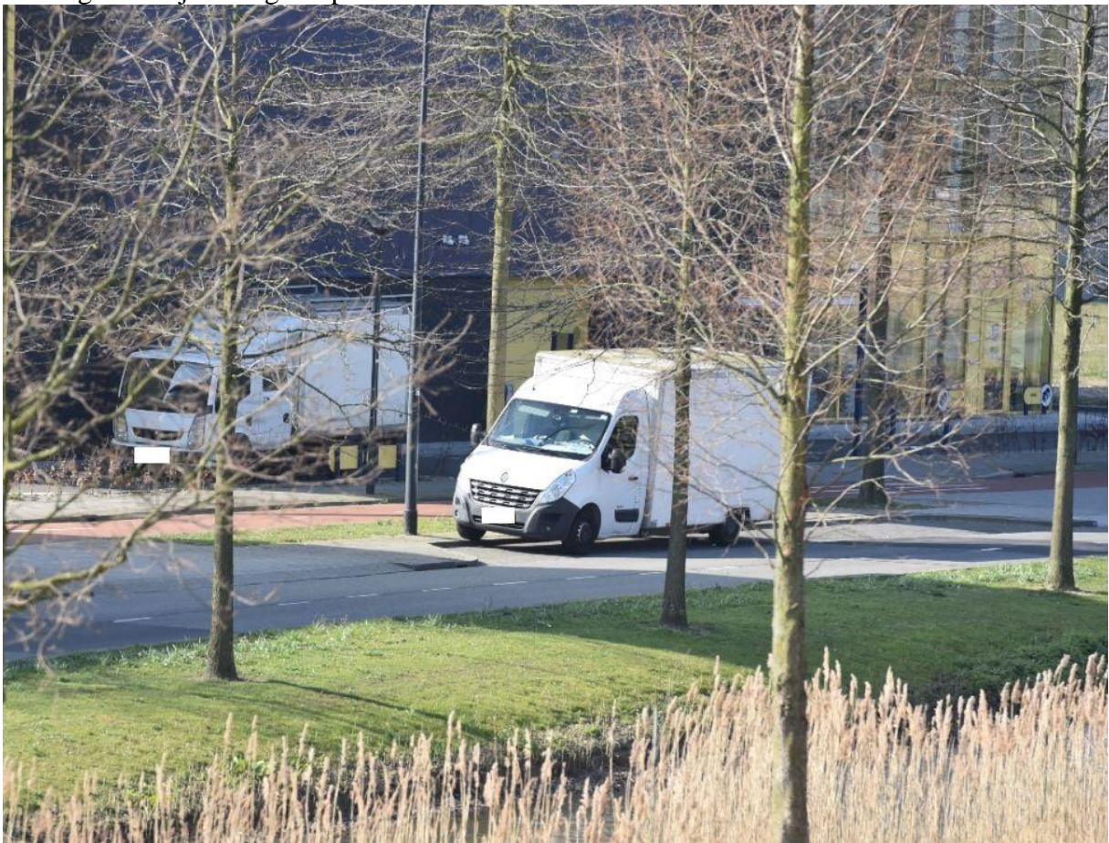
20. Tegen de rijrichting in op het terrein van Allsafe