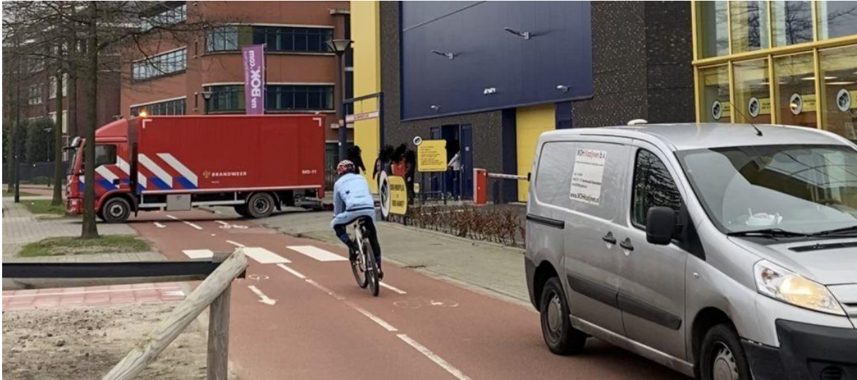
8. Lossen met blokkeren fietspad en trottoir.