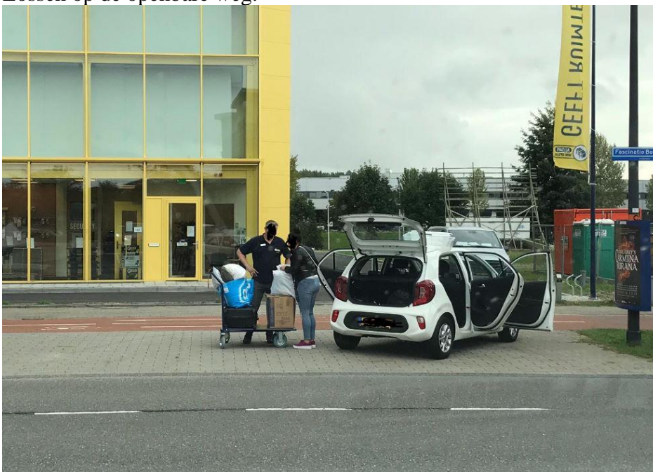
10. Lossen waar het niet hoort.