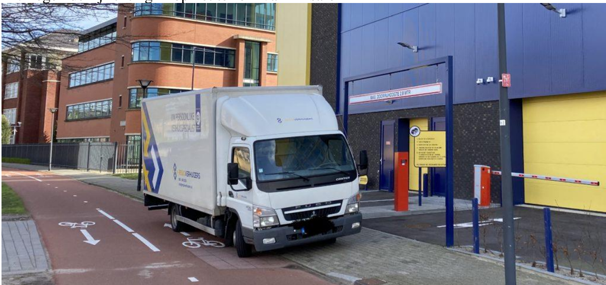
13. Te hoog. Blokkeert inrit, trottoir en fietspad.