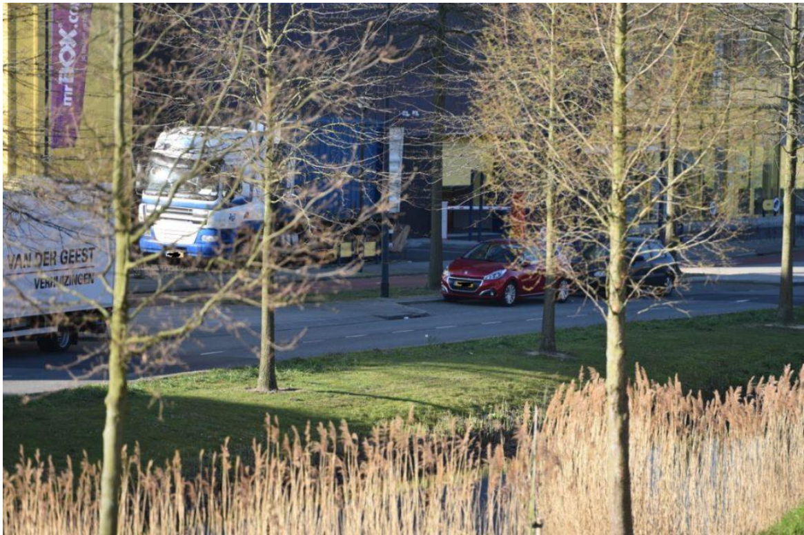
27. Tegen de rijrichting in op het terrein van Allsafe (06-04-2020)