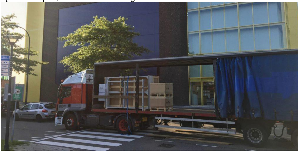
5. Lossen op de zebra en openbare weg.

op het fietspad, scooter raast er langs.