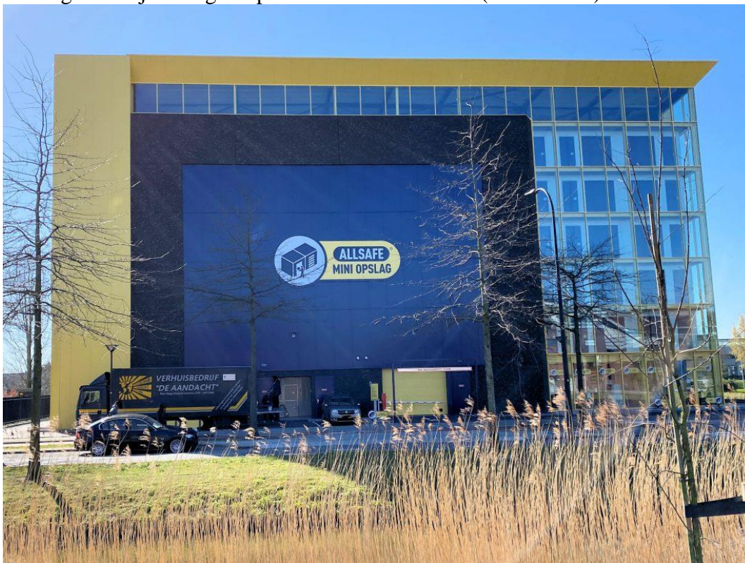
26. Tegen de rijrichting in op het terrein van Allsafe (04-04-2020)