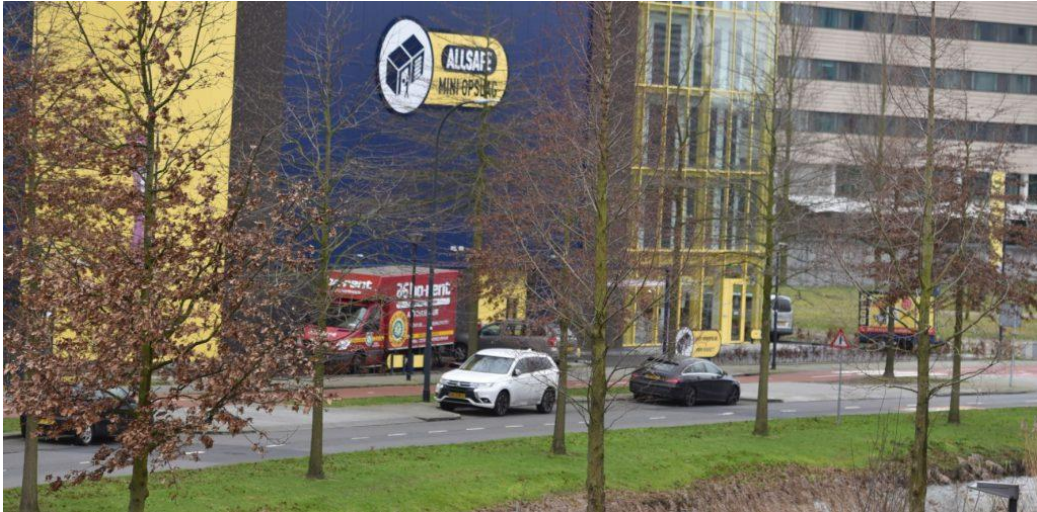
11. Tegen de rijrichting in op het terrein van Allsafe