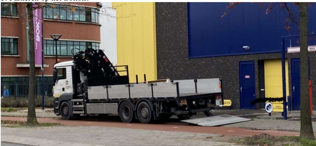
Lossen op het fietspad.