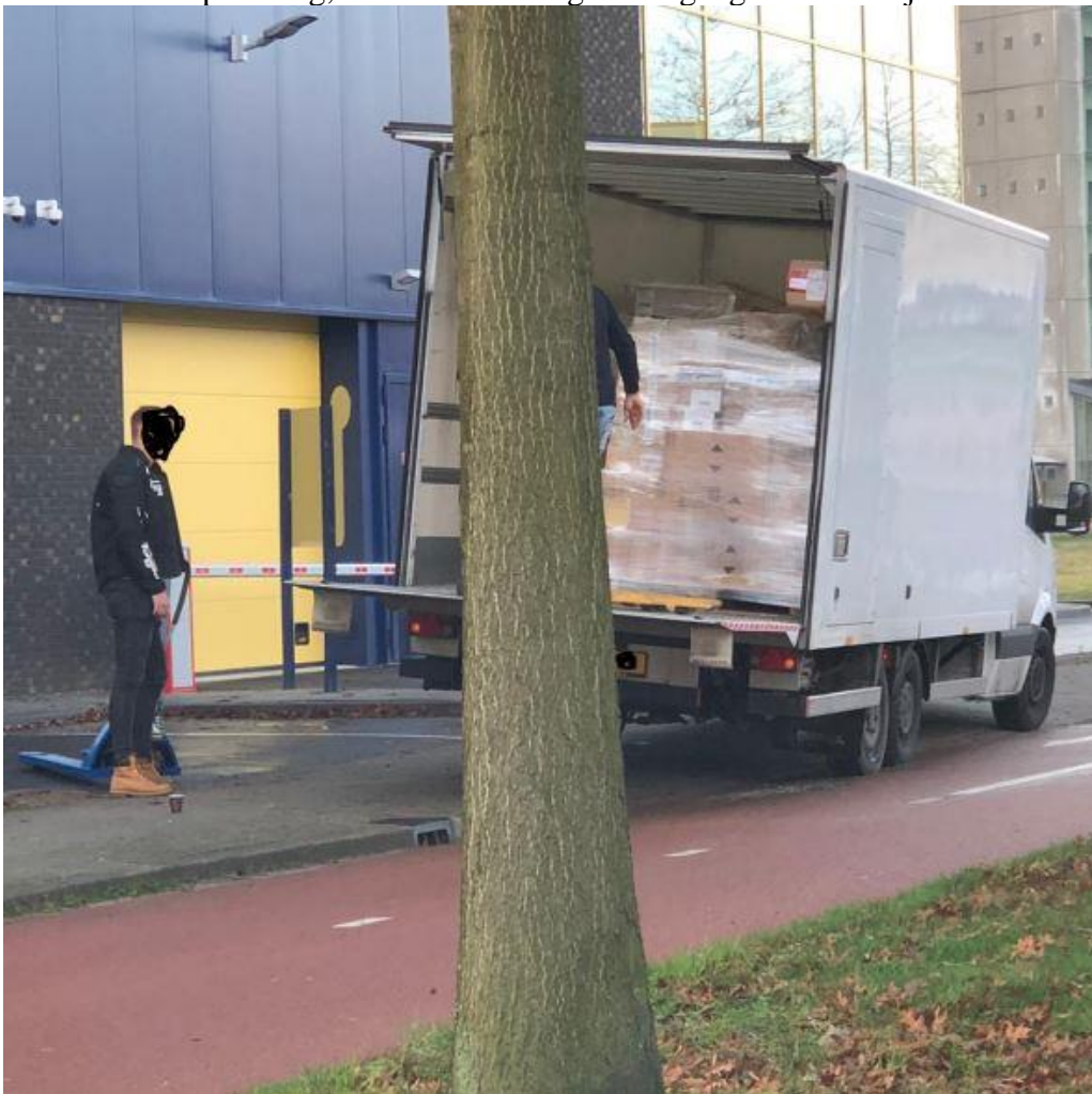
21. Parkeren op het troittoir en voor de uitrit (22-11-2019)