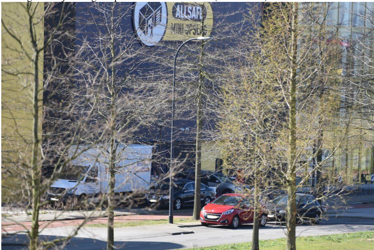
28. Tegen de rijrichting in op het terrein van Allsafe en een auto blokkeert het volledige trottoir (06-04-2020)