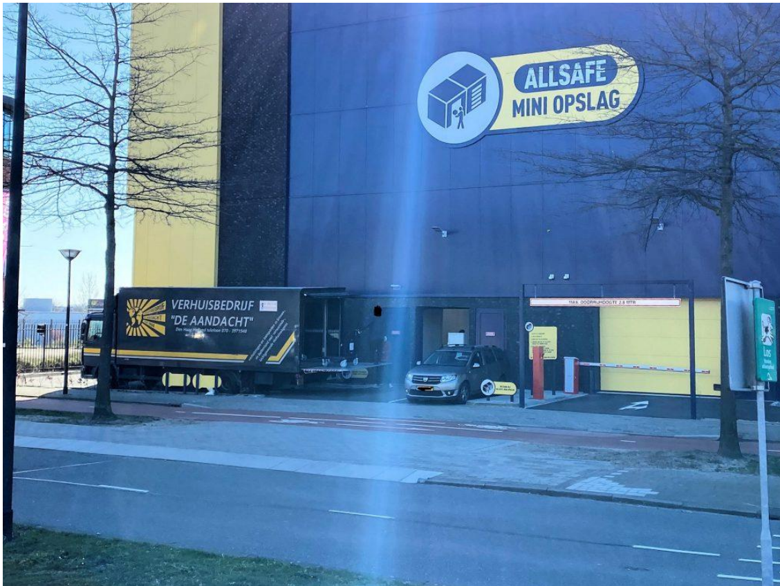
25. Tegen de rijrichting in op het terrein van Allsafe (04-04-2020)