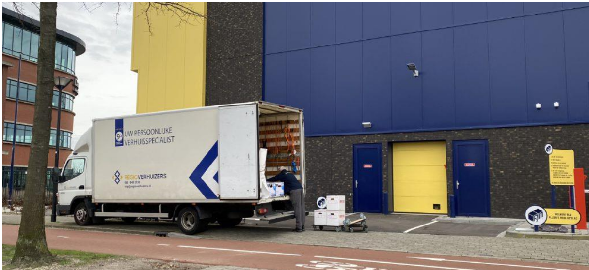
14. Te hoog. Blokkeert inrit, trottoir en fietspad.