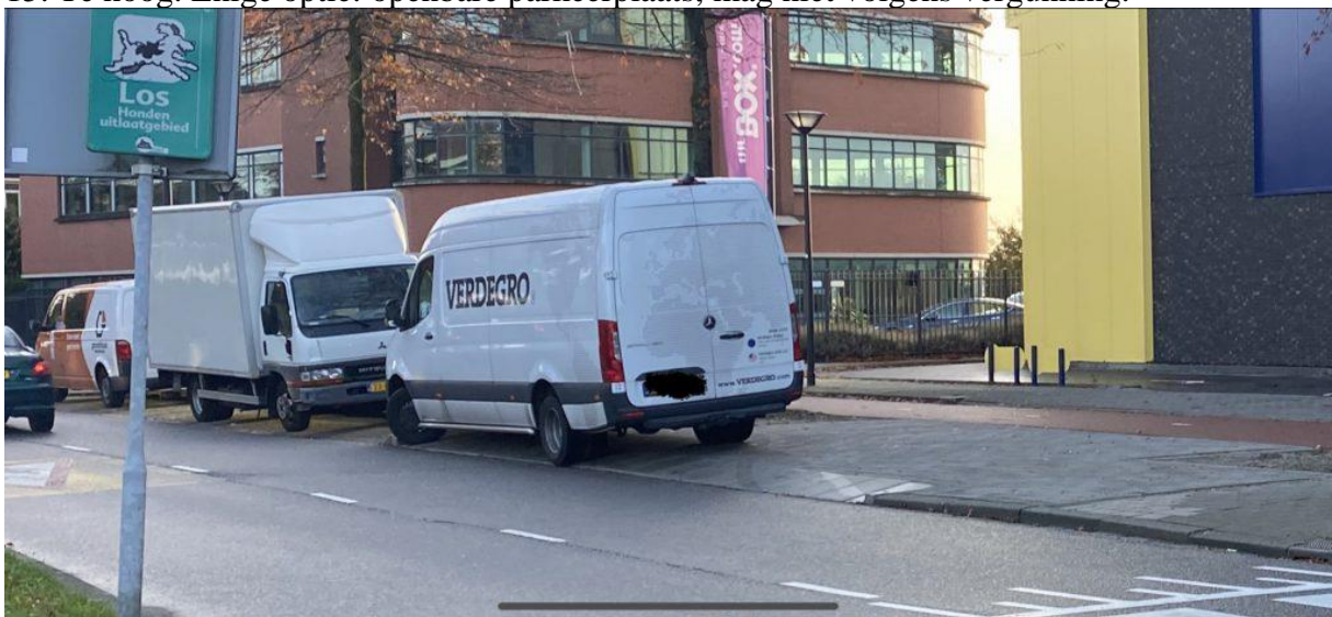
16. Blokkeren van de inrit / uitrit van Allsafe