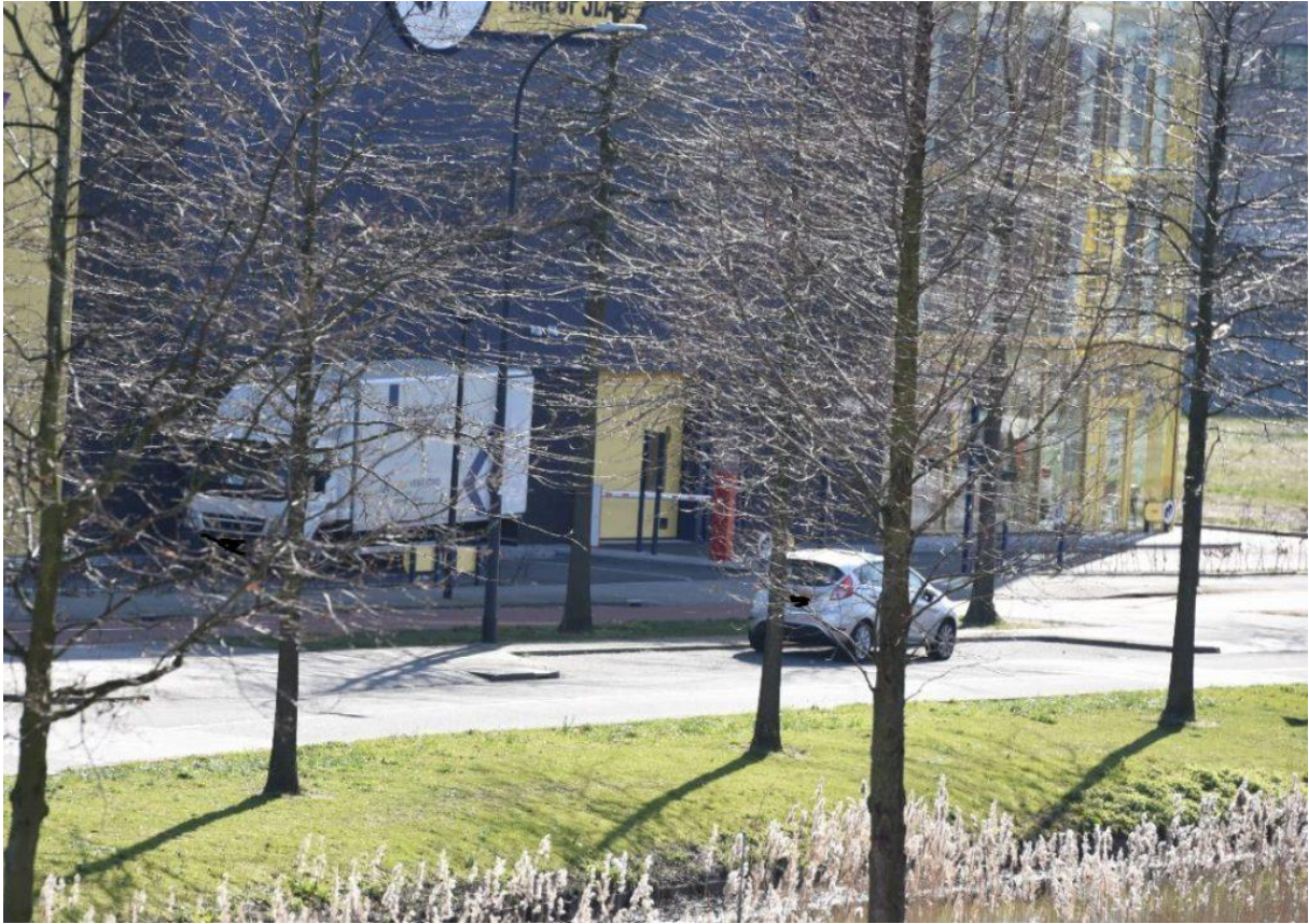
19. Tegen de rijrichting in op het terrein van Allsafe