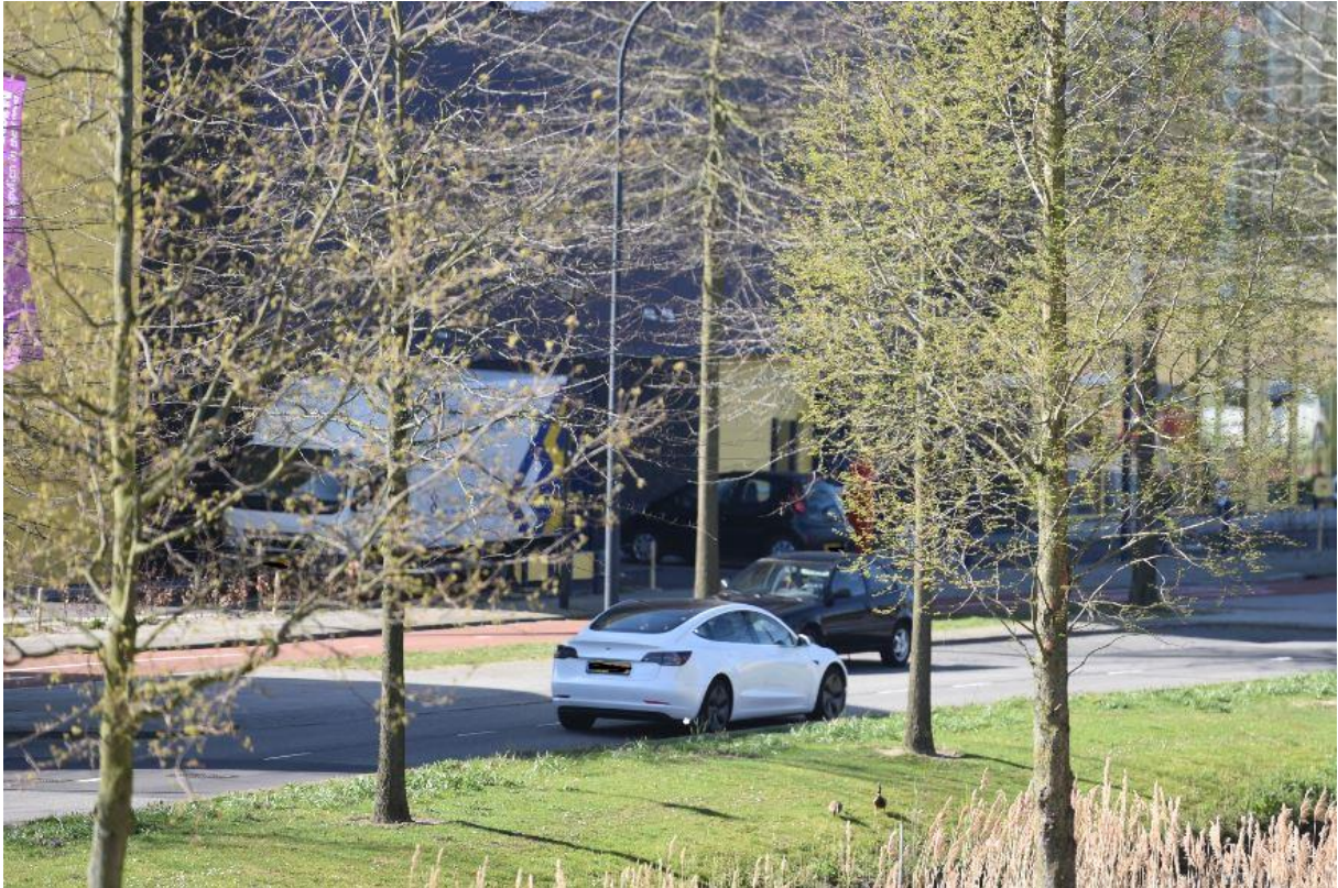
29. Tegen de rijrichting in op het terrein van Allsafe (10-04-2020)