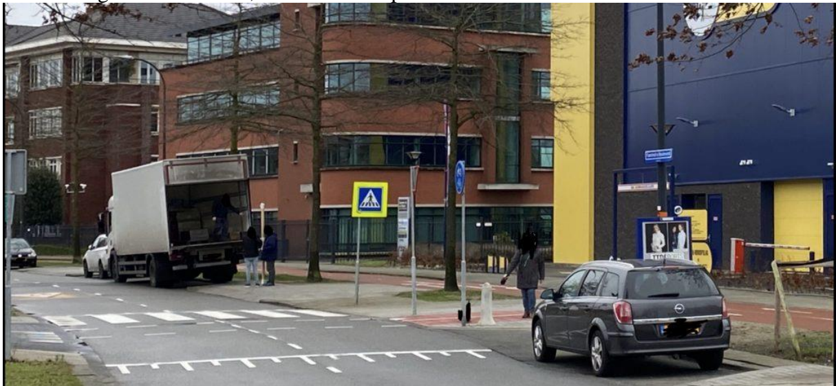
15. Te hoog. Enige optie: openbare parkeerplaats, mag niet volgens vergunning.