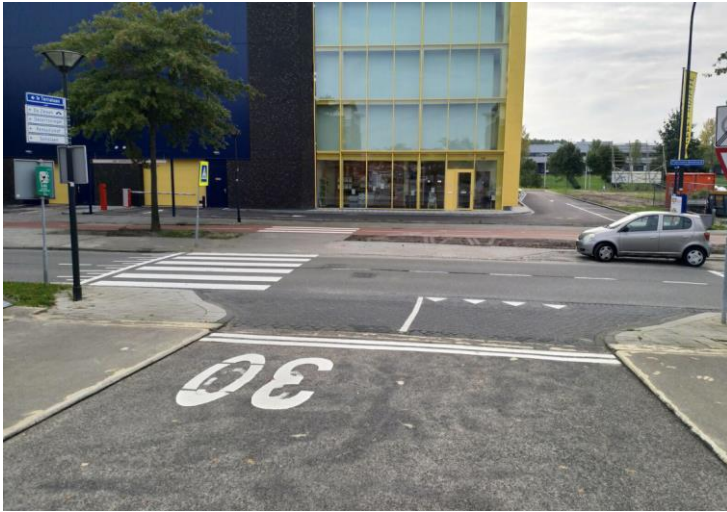
Foto 1: Onveilige situatie aan de Fascinatio Boulevard 702: Twee "nieuwe" openbare parkeerplaatsen onderaan de brug. Geen veilige oversteek meer voor voetgangers aan beide zijden van de brug