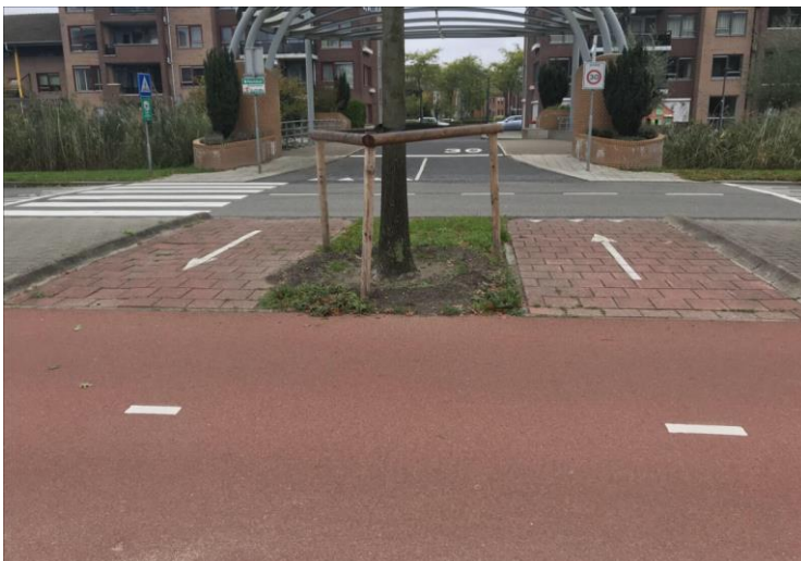
Foto 3: Veilige inrichting bij de Fascinatio Boulevard ter hoogte van Thyssen Krupp. Dit ontwerp staat een veilige oversteek toe voor voetgangers en fietsers aan beide zijden van de brug. Tevens is hier een heldere aansluiting op het fietspad gerealiseerd.