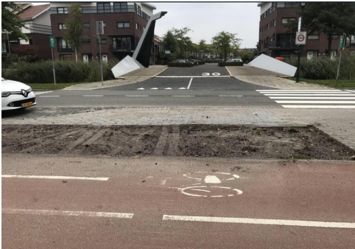
Foto 2: Onveilige situatie aan de Fascinatio Boulevard 702: Twee "nieuwe" openbare parkeerplaatsen onderaan de brug. Geen veilige oversteek meer voor voetgangers aan beide zijden van de brug.