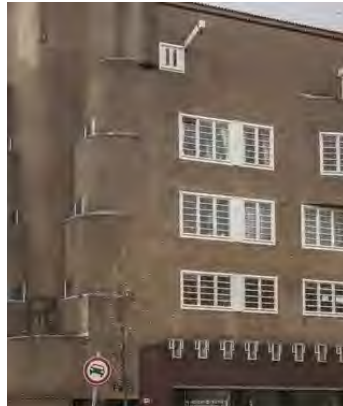
sprekende witte kozijnen