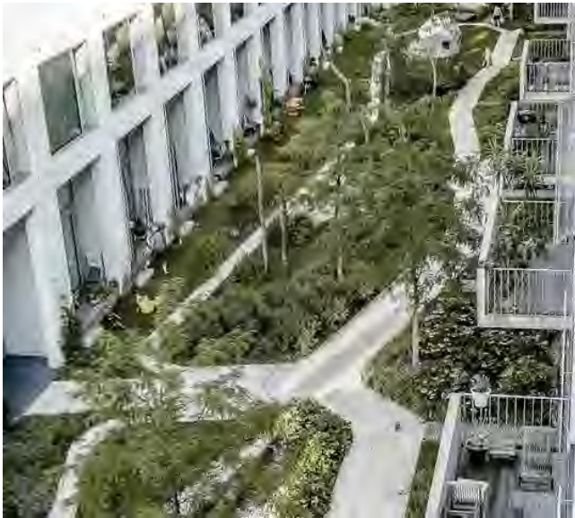
informele paadjes door weelderig groen

hof als hoogwaardige buitenruimte voor woningen