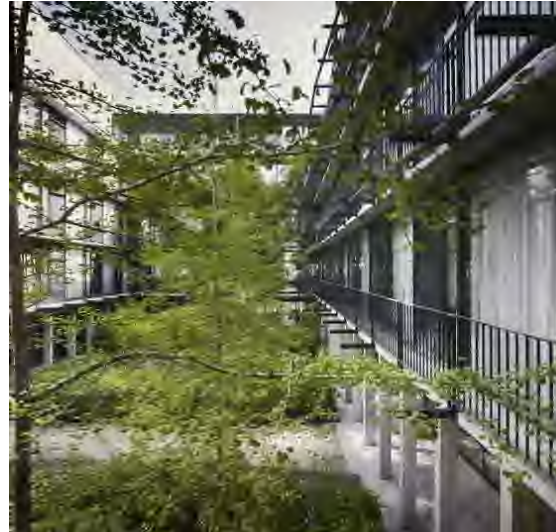
groen ook op verdieping ervaarbaar