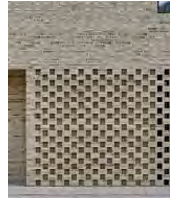
Braziliaans metselwerk bij plint