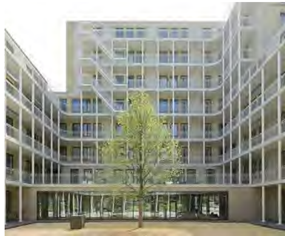
heldere ritmiek en geleiding door kolommen