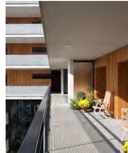
buitenruimte als buffer tussen woning en galerij