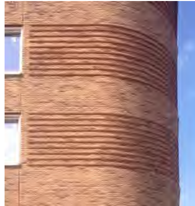
relief en ronde hoeken